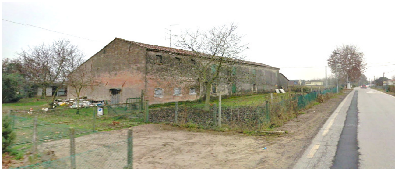
VISTA DELLA CORTE AGRICOLA DALLA VIA TONDELLO