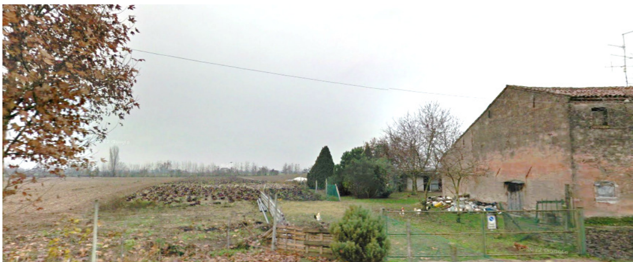
VISTA DELLA CORTE AGRICOLA DALLA VIA TONDELLO